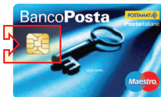
Postamat Maestro BancoPosta con microchip